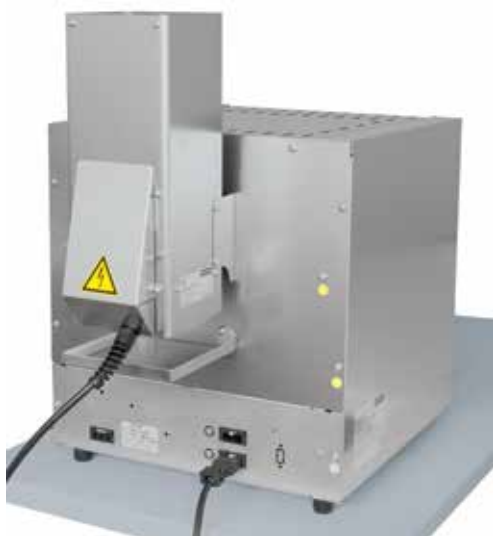
Horno de mufa de laboratorio estándar L 5/11 con catalizador KAT 50 véase página 12

Nabertherm pone a su disposición unos sistemas de limpieza de gases de escape, en particular para la limpieza del aire de escape en los procesos de desaglomerado. La postcombustión se conecta fijamente a las toberas de salida del horno y se incluye de forma correspondiente en la regulación y en la matriz de seguridad del horno. Para aquellos conjuntos de hornos que ya estén instalados, también hay sistemas independientes de limpieza de gases de escape, que pueden ser regulados y manejados por separado.