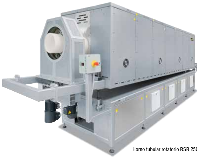
Horno tubular rotatorio RSR 250/3500/15S