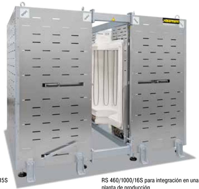
RS 460/1000/16S para integración en una planta de producción

Mediante un alto grado de flexibilidad e innovación Nabatherm ofrece la solución óptima para aplicaciones específicas del cliente.