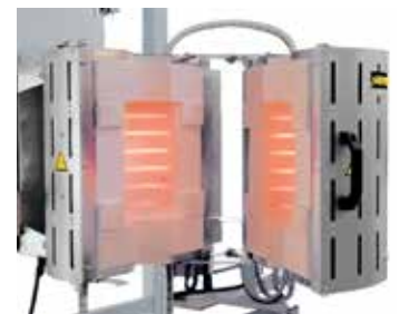
RS 100/250/11S en acabado desplegable para montaje en un dispositivo de prueba.

Sobre la base de nuestros modelos básicos también elaboramos variantes individuales para la integración en unidades de proceso superiores. Las soluciones representadas en esta página solo son una parte de las posibilidades. Desde trabajos bajo atmósfera de vacío o de gas inerte, pasando por la innovadora técnica de regulación y automatización, hasta las más diferentes temperaturas, tamaños, longitudes y propiedades de la instalación de hornos tubulares – nosotros hallamos la solución para una optimización adecuada del proceso.