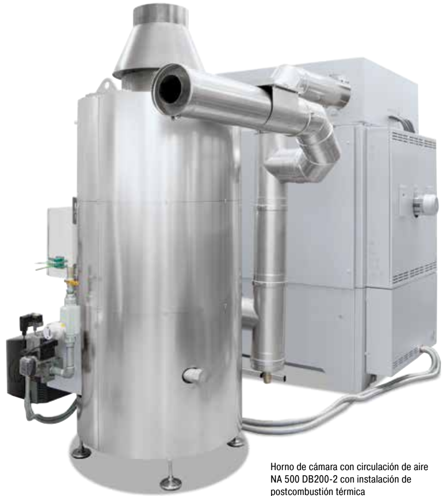
Horno de cámara con circulación de aire NA 500 DB200-2 con instalación de postcombustión térmica