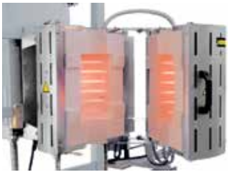
RS 100/250/11S en acabado desplegable para montaje en un dispositivo de prueba.

Mediante un alto grado de flexibilidad e innovación Nabatherm ofrece la solución óptima para aplicaciones específicas del cliente.