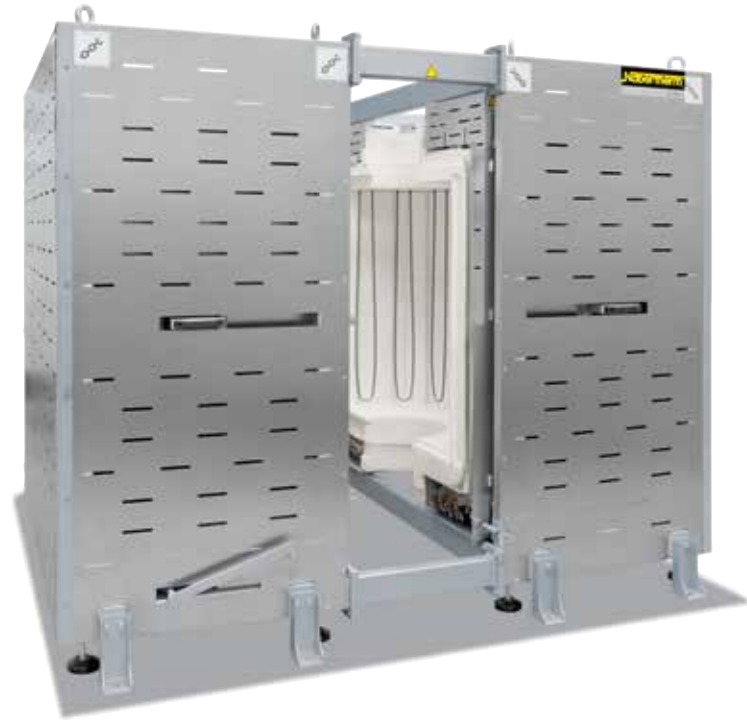
RS 460/1000/16S para integración en una planta de producción