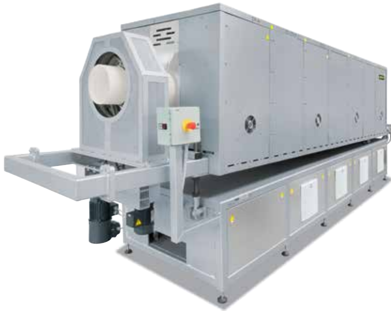
Horno tubular rotatorio RSR 250/3500/15S