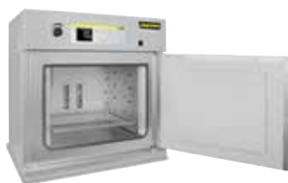
Estufas de secado TR 240 para secar polvos