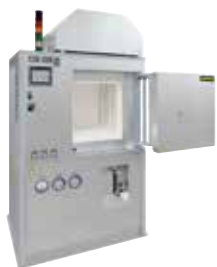
HT 160/17 DB200 para la desaglomeración y la sinterización de cerámicas después de la impresión 3D

La fabricación capa a capa permite la transformación directa de archivos de construcción en objetos plenamente operativos. Por medio de la impresión 3D se fabrican capa a capa objetos de metal, plástico, cerámica, vidrio, arena u otros materiales hasta que adopten su forma definitiva.