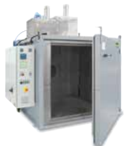
Secador de cámara KTR 2000 para endurecer aglomerantes después de la impresión 3D