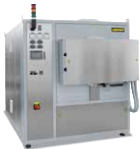
Horno de retorta NR 150/11 para el recocido para eliminar tensiones de piezas metálicas después de la impresión 3D