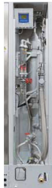
Depuradora de gases perdidos para la depuración de los gases de proceso por lavado

Un lavador de gases de escape se suele utilizar si se producen gases de escape que no permiten su tratamiento posterior con éxito mediante una antorcha de gases de escape o una postcombustión térmica. Los componentes indeseables del gas de escape se separan dentro del tramo de contacto del lavador en un líquido de lavado. El lavador se puede adaptar a cada proceso mediante la selección del líquido de lavado así como su dimensionamiento según la misión del líquido y el tramo de contacto, de forma que elimina con éxito los componentes gaseiformes, líquidos y sólidos del gas de escape.