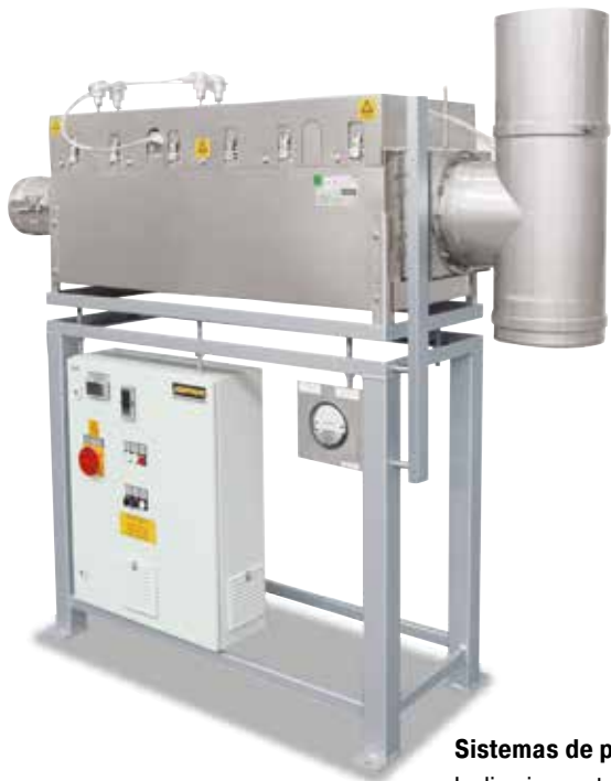
Postcombustión catalítica independiente del horno para equipamiento posterior en instalaciones existentes

Nabertherm pone a su disposición unos sistemas de limpieza de gases de escape, en particular para la limpieza del aire de escape en los procesos de desaglomerado. La postcombustión se conecta fijamente a las toberas de salida del horno y se incluye de forma correspondiente en la regulación y en la matriz de seguridad del horno. Para aquellos conjuntos de hornos que ya estén instalados, también hay sistemas independientes de limpieza de gases de escape, que pueden ser regulados y manejados por separado.