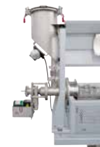
Generador de vibraciones en la tolva de llenado para un mejor suministro de polvo