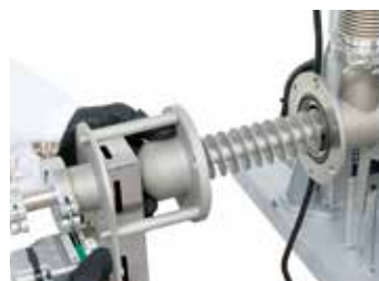
Sinfin con número ajustable de revoluciones por minuto

Dependiendo de proceso, la carga y la temperatura máxima requerida, se pueden utilizar diferentes tubos de trabajo de cristal de cuarzo, cerámica o metal. Por tanto, este horno tubular rotatorio es altamente adaptable para diferentes procesos.