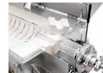
Adaptadores para el empleo alternativo con tubo de trabajo o reactor de procesos