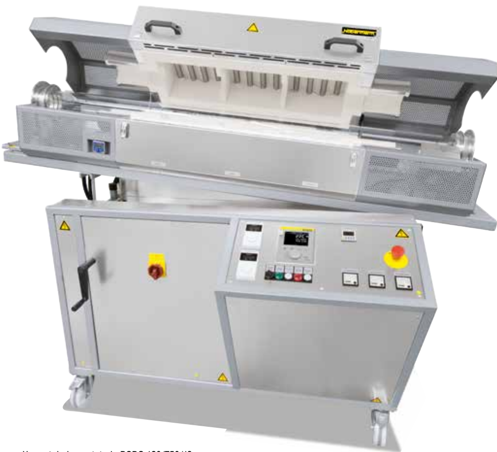
Horno tubular rotatorio RSRC 120/750/13

Los hornos tubulares rotatorios RSRC son especialmente adecuados para procesos en los que se trata el lote de forma continuada, calentando durante un período corto de tiempo.