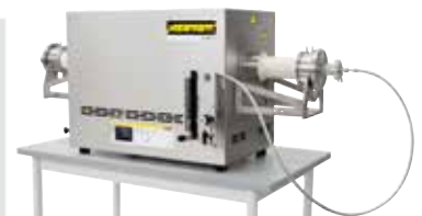
Horno tubular compacto para la sinterización o el recocido para eliminar tensiones después de la impresión 3D en atmósfera de gas protector o en vacío.