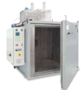
Secador de cámara KTR 2000 para endurecer aglomerantes después de la impresión 3D