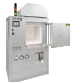
HT 160/17 DB200 para la desaglomeración y la sinterización de cerámicas después de la impresión 3D

También los procesos paralelos o previos a la fabricación aditiva, como p.ej. el tratamiento térmico o el secado de los polvos, requieren la utilización de un horno para conseguir las características de producto deseadas.