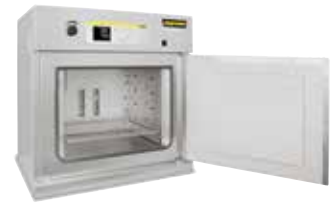
Armario secador TR 240 para secar polvos