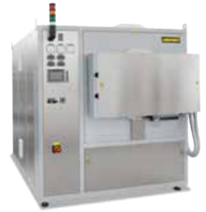
Horno con retorta NR 150/11 para el recocido para eliminar tensiones de piezas metálicas después de la impresión 3D