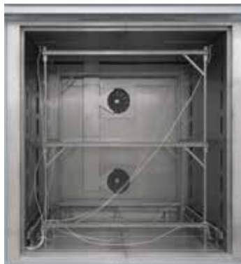
Bastidor conectable para medición, para hornos de cámara con aire circulante N 7920/45 HAS