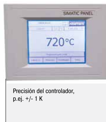
Precisión del controlador, p.ej. +/- 1 K

En el horno estándar se garantiza una homogeneidad de la temperatura en +/- K sin medición del horno. Sin embargo, se puede pedir como equipamiento opcional la medición de la homogeneidad de la temperatura a una temperatura teórica en el espacio útil según DIN 17052-1. Dependiendo del modelo del horno se introduce una estructura en el mismo que corresponde a las dimensiones del espacio útil. En esta estructura se fijan elementos térmicos en posiciones de medición definidas (11 elementos térmicos con sección cuadrada, 9 elementos térmicos con sección circular). La medición de la uniformidad de temperatura se realiza a una temperatura teórica predeterminada por el cliente después de un tiempo de mantenimiento previamente definido. A demanda también se pueden calibrar diferentes temperaturas teóricas o un margen teórico de trabajo definido.