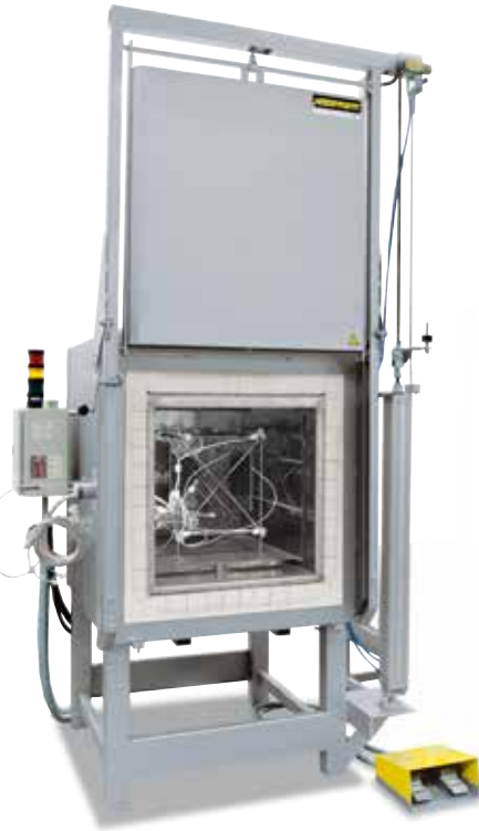
Estructura de medición para determinar la homogeneidad de la temperatura

Se denomina homogeneidad de la temperatura a la diferencia de temperatura máxima definida en el espacio útil del horno. Básicamente se diferencia entre la cámara del horno y el espacio útil del mismo. La cámara del horno es el volumen interior total disponible en el horno. El espacio útil es más pequeño y describe el volumen que se puede utilizar para la carga.