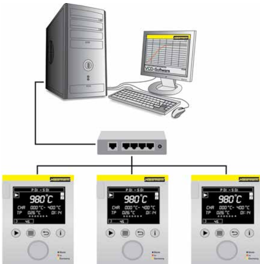
Ejemplo de instalación con 3 hornos