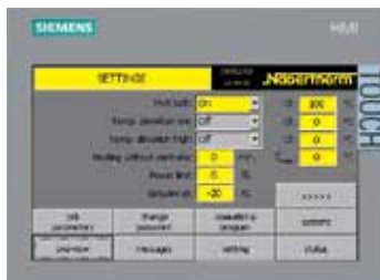
H1700 con representación a color en forma de tabla