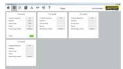
Representación gráfica del sinóptico (versión con 4 hornos)