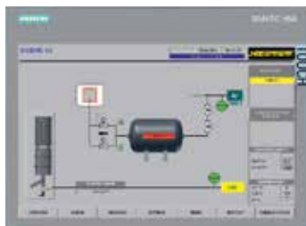
H3700 con representación gráfica

Nabertherm cuenta con una larga experiencia en el diseño y montaje de instalaciones estándar de regulación específicas para clientes. Todos los controladores destacan por su gran comodidad de manejo e incluso la versión base cuenta con numerosas funciones fundamentales.