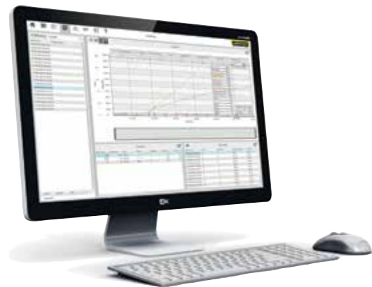
Software VCD para el control, visualización y documentación

El software VCD sirve para el registro de datos del proceso de los controladores B400/B410, C440/C450 y P470/P480. Se pueden almacenar hasta 400 diferentes programas de tratamiento térmico. Los controladores se inician y se paran a través del software. El proceso se documenta y se guarda de forma correspondiente. La visualización de los datos se puede realizar en un diagrama o como hoja de datos. También es posible la transmisión de los datos de proceso en MS Excel (en formato *.csv) o la generación de un informe en formato PDF.