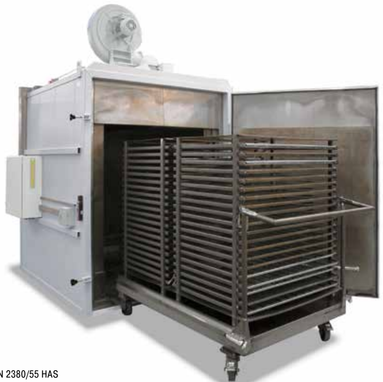
N 2380/55 HAS Instalación de horno con circulación de aire, fabricación a medida para el cliente, incluido vagoneta de carga para revenido de chapas planas