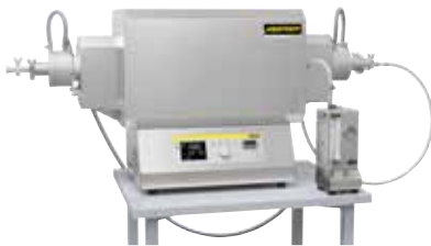
Horno tubular compacto para la sinterización o el recocido para eliminar tensiones después de la impresión 3D en atmósfera de gas protector o en vacío.