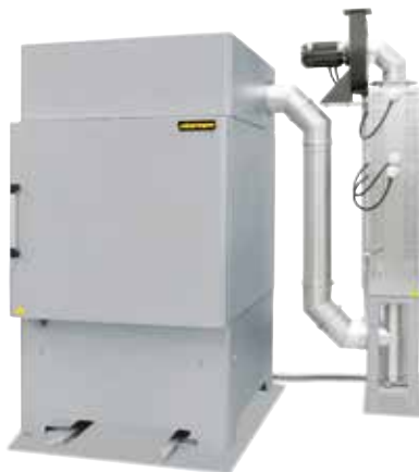
Hornos de cámara con circulación de aire NA 500/65 DB200 con sistema de postcombustión catalítica

La limpieza catalítica del aire de escape recomendada por motivos energéticos, para aquellos procesos de desaglomerado durante los cuales únicamente se deben eliminar compuestos de carbono puro. Se recomiendan para pequeñas y medianas cantidades de gases de escape.