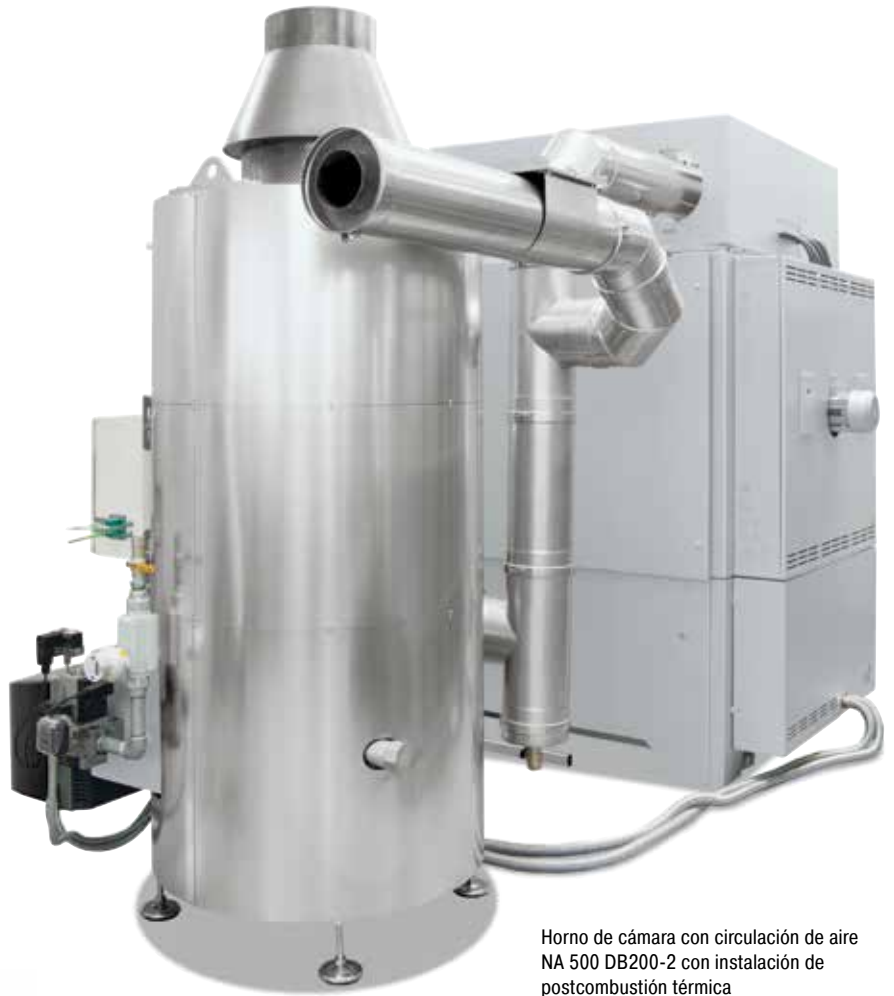
Horno de cámara con circulación de aire NA 500 DB200-2 con instalación de postcombustión térmica