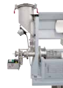
Generador de vibraciones en la tolva de llenado para un mejor suministro de polvo